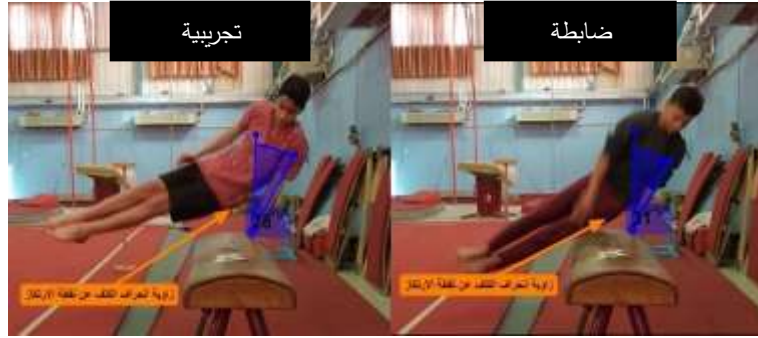
صورة (10) (زاوية انحراف الكتف عن نقطة الارتكاز)

أما بالنسبة للمتغيرات الكينماتيكية التي تم التركيز عليها عند عمل الدراسة، فقد لاحظ الباحثون عدم وجود فروق ذات دلالة إحصائية عند مستوى الدلالة ( 0.05 \geq \alpha )، ويعود ذلك لأن الزوايا المثلثية التي تم التعامل معها (زاوية الرسغ لحظة الارتكاز، زاوية الجذع الأمامية أثناء المرجحة، زاوية انحراف الكتف عن نقطة الارتكاز) سواء عند أفراد المجموعة التجريبية أو المجموعة الضابطة كانت زوايا مثالية للأداء، بحيث لا يمكن التطوير عليها أو تغييرها من أجل تحسين الأداء، ولكن يرى الباحثون أن هذه الزوايا تشابهت مع القياسات عند إجراء التحليل الحركي، فظهرت القياسات متشابهة مما جعل الفروق غير دالة إحصائياً. ولكن كان مستوى الأداء مختلف بين المجموعتين عياناً، وهذا جعل أفراد المجموعة التجريبية يؤدون بشكل أفضل وأكثر جمالية للأداء حيث أنّ رياضة الجمباز تتطلب انسيابية بالحركة المؤداة.