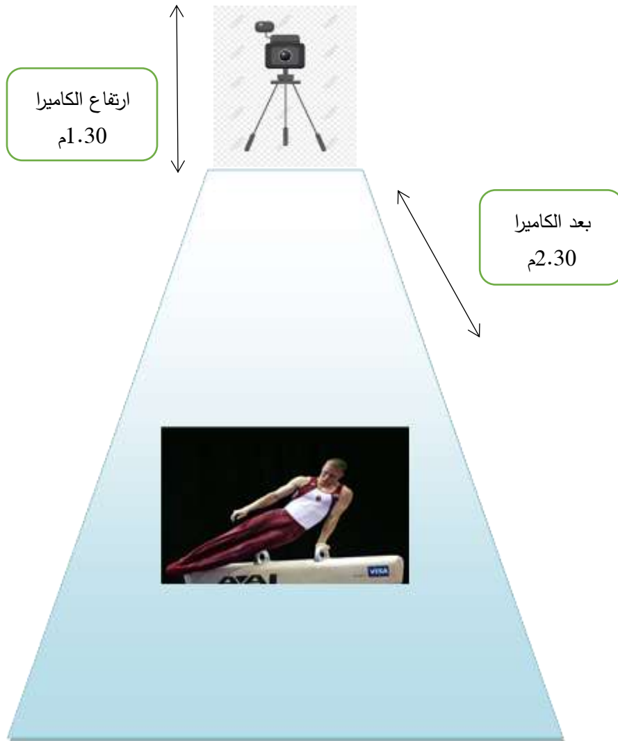
الشكل رقم (1) موقع وضع الكاميرا أثناء التصوير

المستوى الأمامي والمحور العميق لضمان تصوير المتغيرات الكينماتيكية المطلوبة عند أداء المهارة، وكانت تبعد الكاميرا عن جهاز حضان الحلق مسافة (2.30)م، وارتفاع (1.30)م عن الأرض. والإجراءات نفسها تم تطبيقها في القياسات البعدية يوم السبت الموافق 2022 / 1 / 15.