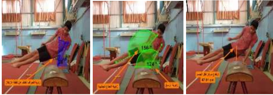
صورة (2) ارتفاع مركز ثقل الجسم عن جهاز حصان الحلق صورة (3) زاوية الرسغ لحظة الارتكاز، زاوية الجذع الجانبية أثناء المرحة صورة (4) زاوية انحراف الكتف عن نقطة الارتكاز

وفيما يخص المتغيرات الكينماتيكية التي لم يحدث عليها أي تحسن يرى الباحثون أن الزاوية المثلى للأداء تكون ثابتة عند جميع اللاعبين سواء المتطورين أو الناشئين، ويعود ذلك لطبيعة الأداء المهاري؛ حيث إن مهارة المرجات الدائرية الأمامية للرجلين على جهاز حصان الحلق تعتبر من المتطلبات الأساسية، إذ يقوم اللاعب بالدوران ومرحة الرجلين حول الجهاز، وهذا بدوره يجعل اللاعب يدخل في زوايا محددة تكون ثابتة عند جميع اللاعبين وذلك لأداء ناجح للدورات. أما بالنسبة للمتغير المهاري (عدد الدوران) فقد ظهر هناك فرق دال إحصائياً لدى المجموعة التجريبية في القياس البعدي، ويعود ذلك لطبيعة البرنامج التدريبي باستخدام تدريبات البلايومترك الذي كان هدفه تطوير عناصر اللياقة البدنية، مما انعكس ذلك على قدرة اللاعبين على زيادة عدد التكرارات، وهذا يعطينا مؤشر واضح أن التدريب البلايومترك الذي يكون بنفس خط سير الحركة قد ساهم بشكل كبير بتحسين الأداء. ويرى (النمر والخطيب 2005) أن من أهم مميزات تدريبات البلايومترك أنها تزيد من الأداء الحركي بمعنى أن القوة المكتسبة من هذا النوع من التدريبات تؤدي إلى أداء حركي أفضل.